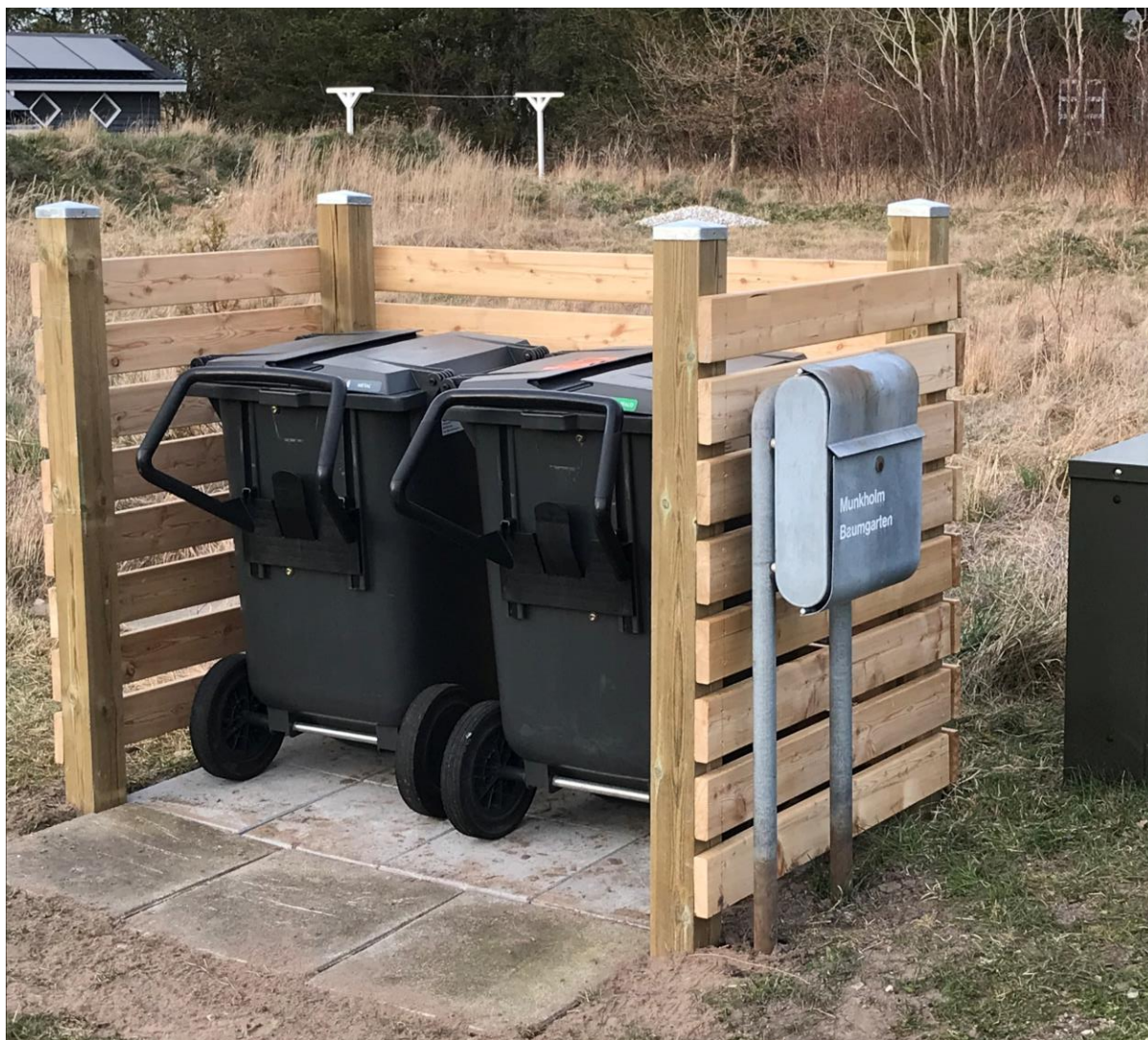
Klitrosevejs grundejerforening og stilaug